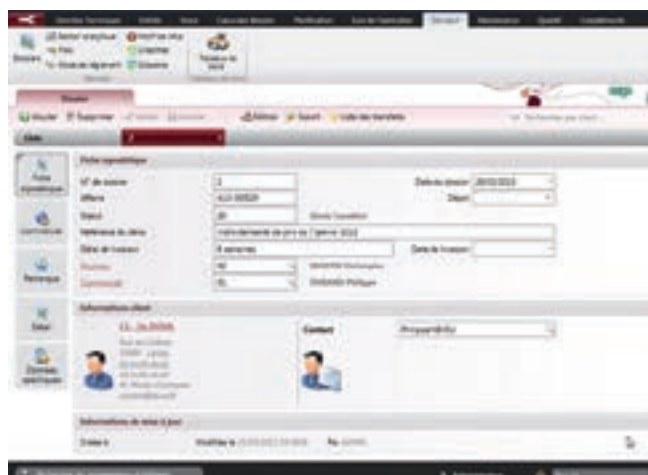
Fiche signalétique d'un devis technique regroupant les informations principales Dossier / affaire / intervenants (technique commerciale / client)